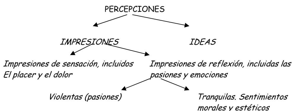
Cuadro- Clasificación del contenido de la mente humana por Hume.

Por último Hume distinguió entre percepciones simples y complejas. Una impresión simple corresponde a una sensación elemental e indivisible como, por ejemplo, la visión de un punto azul de tinta. La mayoría de las impresiones son complejas, ya que nuestros sentidos están expuestos normalmente a muchas sensaciones simples de forma simultánea. Las ideas simples son copias de las impresiones simples, mientras que las ideas complejas son agregados de ideas simples. Las ideas complejas pueden ser descompuestas en ideas simples, que son copias de impresiones simples. Hume defendía una posición positivista, según la cual todas las ideas significativas deben ser reducidas a un elemento observable y fue un atomista psicológico al defender que las ideas complejas se construyen a partir de sensaciones simples. Según Hume tan sólo existen tres principios de conexión entre ideas que podemos denominar semejanza, contigüidad en el tiempo o el espacio y causa - efecto. La semejanza: un retrato nos hace pensar de forma natural a la persona a la que representa. La contigüidad: cuando se menciona la iglesia de Saint Denis surge de forma natural la idea de París. La causalidad: cuando pensamos en el hijo es probable que nuestra atención se desplace hacia el padre.